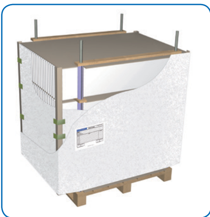
Bacs sur palette chandelles