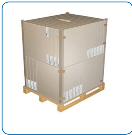
Cartons de cassettes sur palette

L'emballage des produits est réalisé selon les configurations :