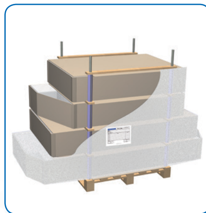
Bacs multi-longueurs sur palette chandelles