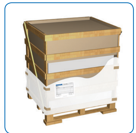
Bacs en caisse claire-voie